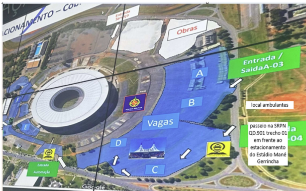
ÁREA 01 – 25 vagas na SRPN QD.901 trecho 01